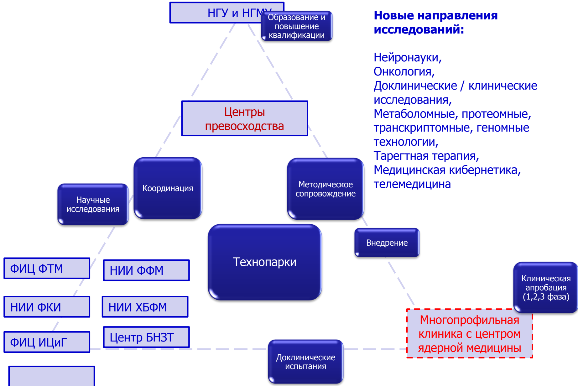
Схема организационного взаимодействия